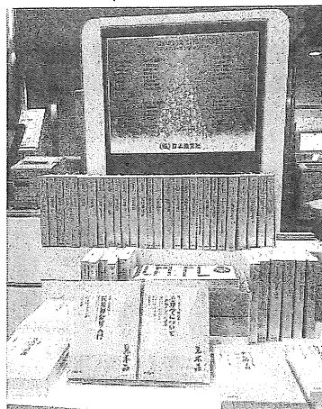
八重洲BC本店でのフェア

重洲ブックセンター本店 などがフェア展開を始 め、好調な売行きを示 している。 オンデマンドにより復 刊したのは「エマソン選